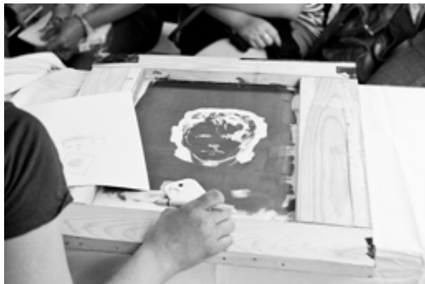
Fráňa na sítu

Co si budeme povídat, ať je program sebevíce poučný, smysl každého festivalu je především v lidech. Přátelích i těch ostatních. Každý rok tu jedni nadzvednou druhé, ze skupiny do skupiny putují rozhořčené nóty, ten je zván kamsi na kobereček a onen je pomlouván nad jahodovým dortíkem. Příležitostí skutečně poznat příslušníky ostatních skupin přímo během oficiálního programu je ovšem spíše poskrovnu – odsedět si vedle sebe přednášku či divadlo za takovou příležitost nepovažují.