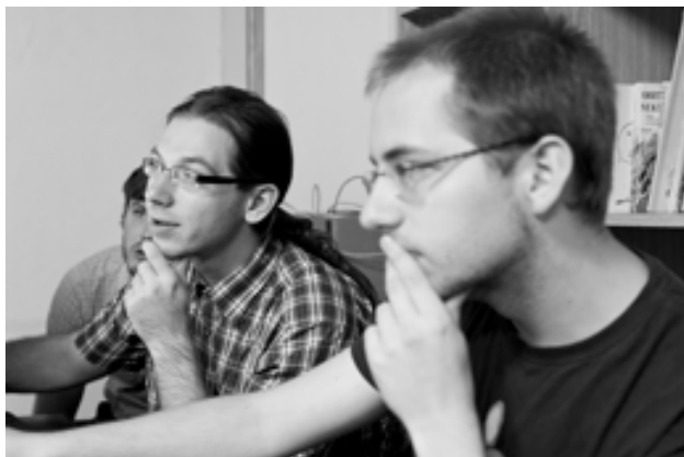
Sazeč a jeho padawan