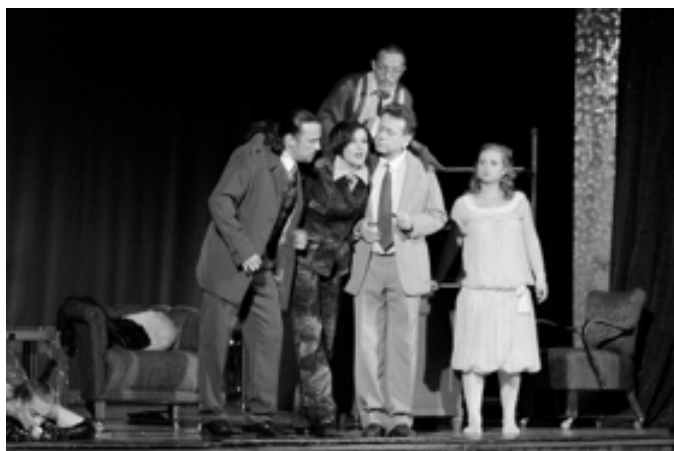
Karel Čapek: Věc Makropulos

Z představení režirovaného Věrou Herajtovou mám poněkud rozporuplné pocity a obávám se, že jsem v řadách publika nebyla ani zdaleka jediná. Nemohu si pomoci, ale výsledným dojmem je pro mě pocit vulgarity. Snad je to jedna z věcí, bez níž se už současný divák, zvyklý na určitý televizní standard, neobejde. Do jisté míry může nahota na jevišti působit uměleckým dojmem, jestliže však nožky zabalené pouze do síťovaných punčoch za celou dobu neopustí scénu, začne se mezi diváky šířit pocit určité rozpačitosti.