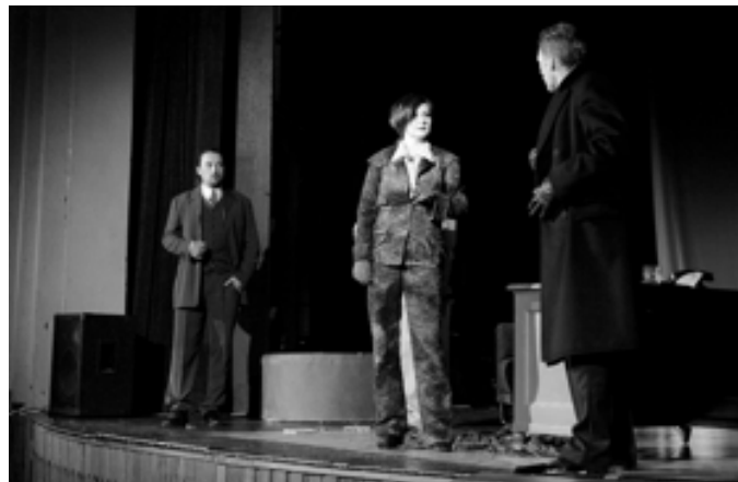
Klicperovo divadlo v Městském divadle