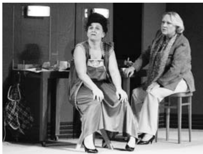
Truda s Lízou