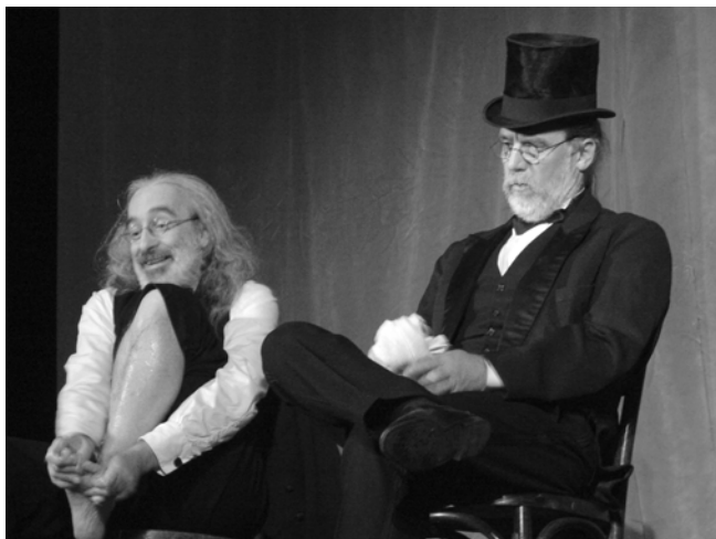
Dva ze tří mužů na voru, mají hlad.

Při sledování Mrožkovy hry Na širém moři je příjemné to vědomí, že intelektuála od prostáčka dělí jen kousek, který navíc může být smazán takovou nicotností, jako je krása nesmyslu. Tři s břichem na vodě, spojení zpočátku podobným viděním světa, projdou kartázi vlastních charakterů, každý jinak, ale shodně bez výsledku. Třebaže cestou hrůzně lidští, zůstávají stejní jako na začátku.