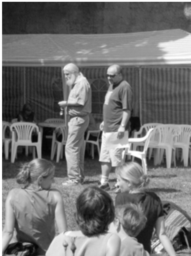
Dvě ohniska rozřazovací elipsy