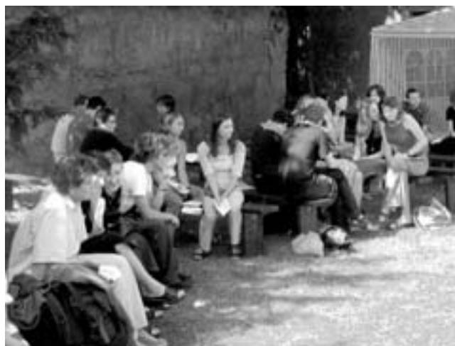
Pět ku jednomu je solidní poměr

O zprávy se postarají vybraní jedinci, kteří nejsou největšími pamětníky a dost možná ani nejskvělejšími recitátory v tomto čase na tomto místě. Jejich dosazení do funkcí není nic než pustá svévole. Zraněný vyznavač demokratických ideálů budiž ubezpečen, že aspoň princip poměrného zastoupení žen a mužů nebyl pošlapán. Pět ku jednomu je solidní poměr.