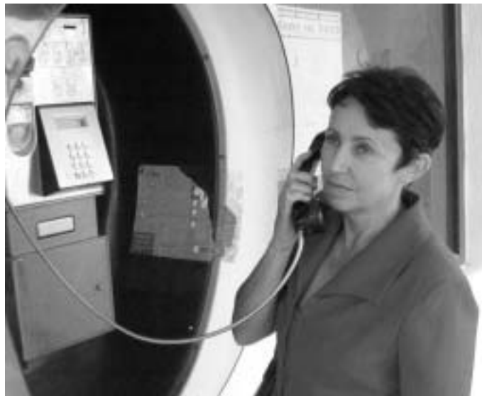
s paní Lenderovou jsme hovořili po telefonu

ML: K objektivnímu posouzení tohoto tématu je zapotřebí