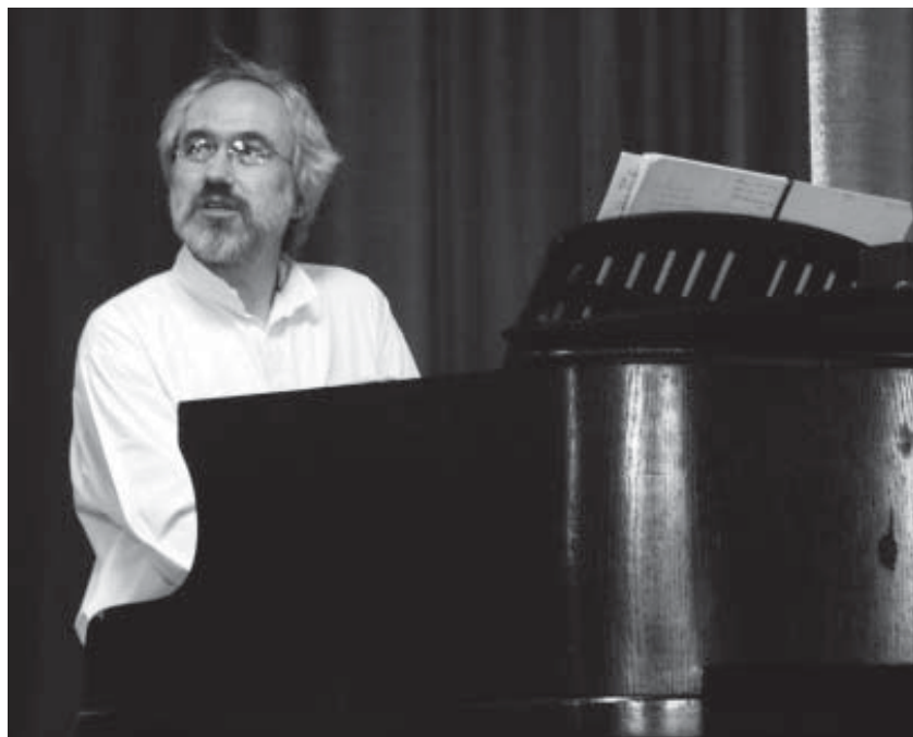
„Těch neznám slov, jež řekl bych a plakal“

R: Já mám dojem, že mu o ženy tak nešlo. Mám na to takovou teorii (a je to i důvod, proč si ho vážím), že se pokusil vyslovit nevyslovitelné. Pokusil se vyslovit smyslový zážitek, a to ten prvotní smyslový zážitek, který je starší než jeho reflexe, prostě dřívější, než si člověk najde figl, jak ho vyjadřovat. Pro mě nejšrámkovštější verš je „Těch neznám slov, jež řekl bych a plakal.“ To je úžasný. To je verš o tom, jak něco nelze říct, ale je