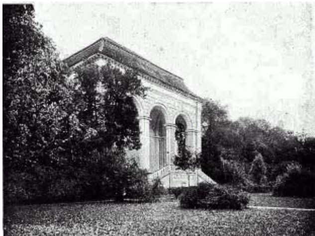
OBR.5. Loretánská kaple u Hlásné Lhoty, architekt Jean Baptiste Mathey, 1694.