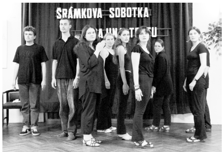
Šrámkova Sobotka skončila mlátičkou